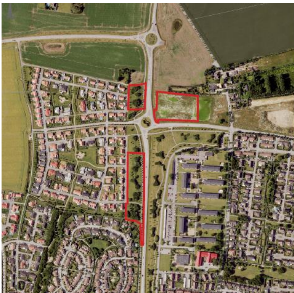
Planområdet, i 3 delar, med omgivningar.

Planhandlingarna består av planbeskrivning och plankarta med illustration.