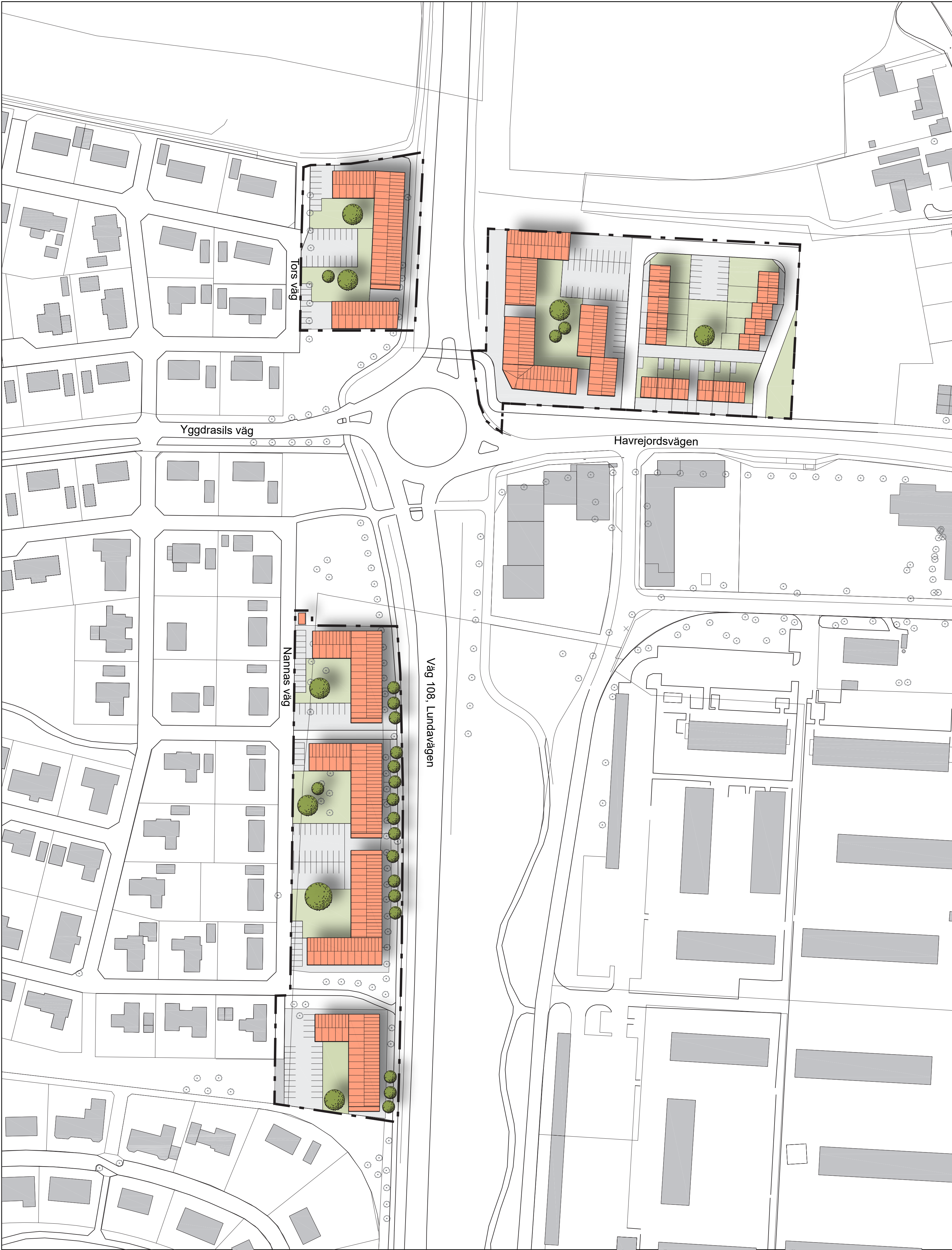
ILLUSTRATION (visar ett möjligt utbyggnadsalternativ)

0 10 20 30 40 50 Meter Skala 1:1000 (A0)