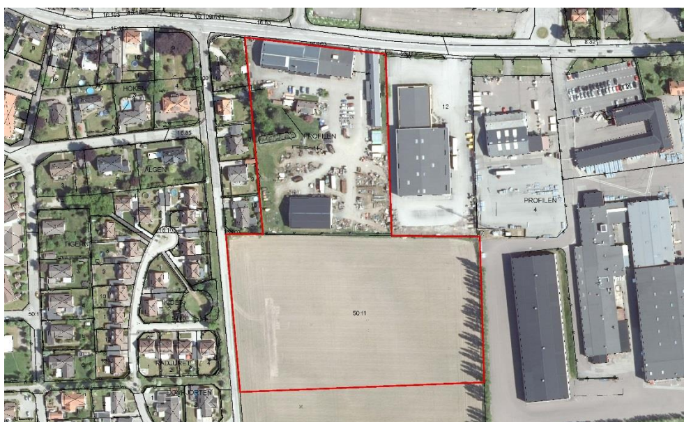
Planområdet med omgivning

Planhandlingarna består av planbeskrivning, plankarta och illustration.