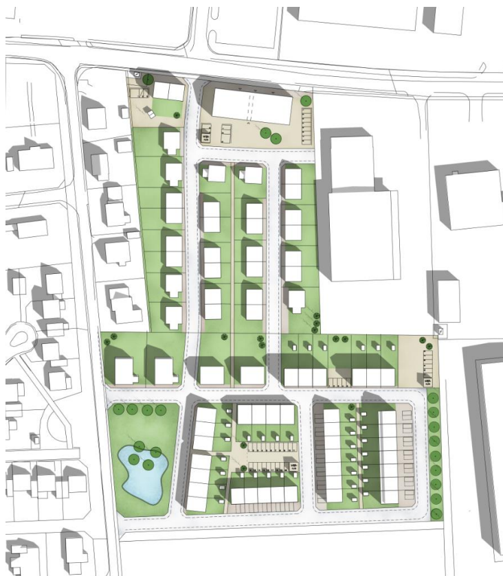
Illustration som visar hur området skulle kunna byggas ut

Upplýsingar lämnas på Samhällsbyggnadsförvaltningen av planarkitekt Sofi Lott tel: 0410-73 43 34, e-post: sofi.lott@trelleborg.se