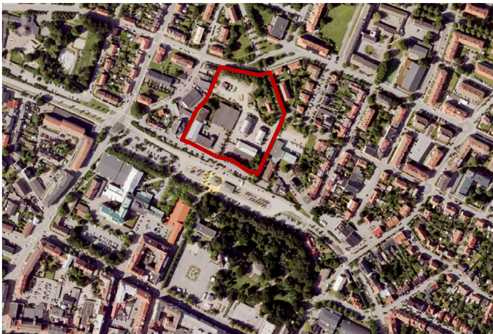
Planområdet med omgivning

Planhandlingarna består av planbeskrivning, plankarta, illustration och planprogram.