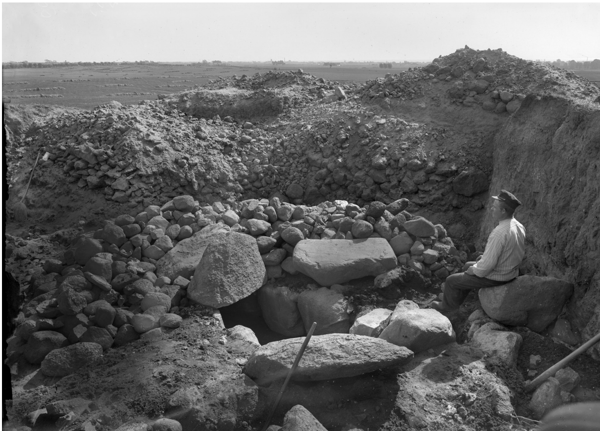
Utgrävning modell Ä av bronsåldershögen Bonhög.

Synliga hällkistor har vi inte så många. Dessa mer direkt kistformade gravar, som kommer på modet ca 2400 f.Kr, har ofta legat dolda under flat mark eller ligger i botten av bronsålderns högar. En väl synlig hällkista, som dock få känner till, är Mogrevestenen i närheten av Fredshög, alldeles intill kustvägen mot Kämpinge. Några intressanta hällkistor, utan taklock, kan man också finna i kanten av en liten och flack hög strax norr om Maglarps by.