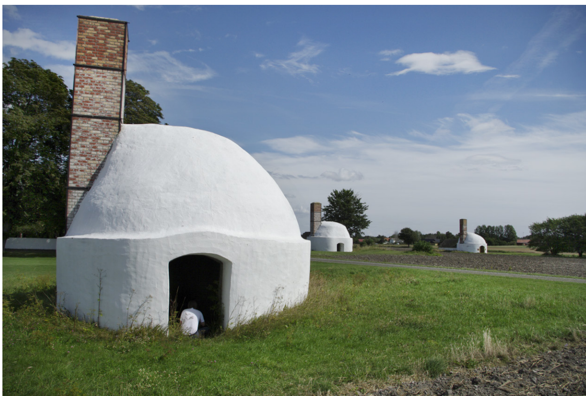
Små hattstugor? Nej, vitmenade kalkugnar!

Köpmansgården är namnet på gården strax öster om hamnen. Det stora pampiga magasinet är byggt i början av 1800-talet och minner om tider när smuggling var ett närtintill aktat levebröd för många, såväl grosshandlare som bönder och deras medhjälpare. Med magasin ända nere vid vattnet hade man stora möjligheter att undgå nitiska tulltjänstemän!