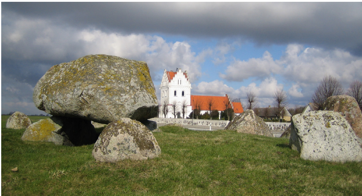
Skegriedösen med Skegrie kyrka i bakgrunden.