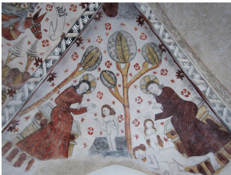
Målningar från valven i Äspö kyrka.

Även kyrkogårdarna innehåller många spännande och intressanta stenar. I Västra Torp finns till exempel en sten som sägs förebåda oväder – den lär gråta innan det kommer regn! Lilla Isie kyrkogård och Lilla Beddinge kyrkogård är två ödekyrkogårdar, båda högst sevärda. Inne i Trelleborg har såväl Västra som Norra Kyrkogården mycket att berätta om gamla tiders stadsbor. Flera kända trelleborgssläkter ligger begravda här. Norra kapellet är i sig också en sevärdhet.