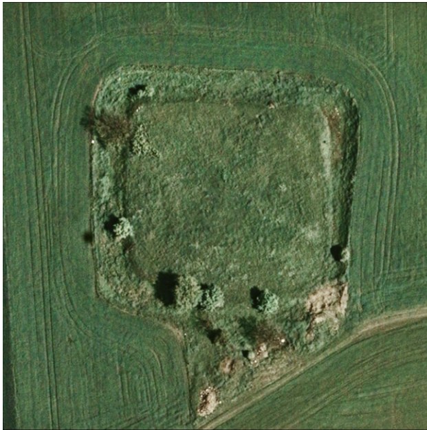
Borgplanen av Svenstorps Herregård är ännu fullt synlig.

Svenstorps Herregård, i utkanten av Trelleborg, är en väpnargård, anlagd i början av 1100-talet. Den låg i norra utkanten av Trelleborg och lämningarna visar ännu en kvadratisk borgplatta med omgivande vallgravar, ca 85 x 85 meter. Vallgravarna är dock inte längre vattenfyllda. Den äldsta bebyggelsen har bestått av enkla klinehus som legat i norra delen av borgen. På 1300-talet tillkom en stallbyggnad i söder. Närmast vallgraven i nordost har det stått en stabilare tegelbyggnad, troligen ett försvarstorn uppfört på 1200-talet. Borgen verkar ha existerat fram till mitten av 1300-talet. Fynden därifrån talar om en välsituerad men krigisk miljö, bland annat fanns här en mängd arm- och borstpilar. På 1360-talet härjades Trelleborg av lybeckarna och kanske var det de som också ödelade Svenstorp.