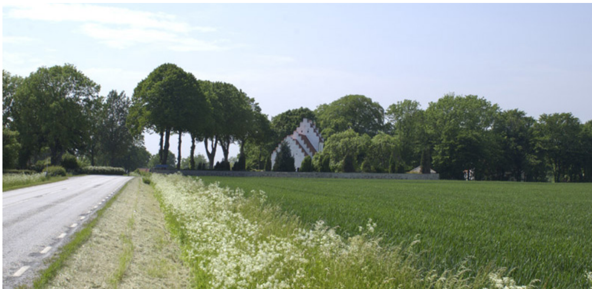
Dalköpinge by och kyrka, inhöljda i lummig grönska.

Även byar med efterleden -köpinge är från slutet av vikingatiden. Norr och nordost om Trelleborg finns tre sådana byar, Kyrkoköpinge, Mellanköpinge och Dalköpinge (från början Östra Köpinge). Ytterligare en -köpingeort , Västra Köpinge, som dock försvann redan under medeltiden, har legat i närheten av nya Vattentornet. En av dessa köpingeorter har varit en marknadsort med handelsrättigheter. Orten bör ha varit föregångare till Trelleborgs stad som bildades i början av 1200-talet.