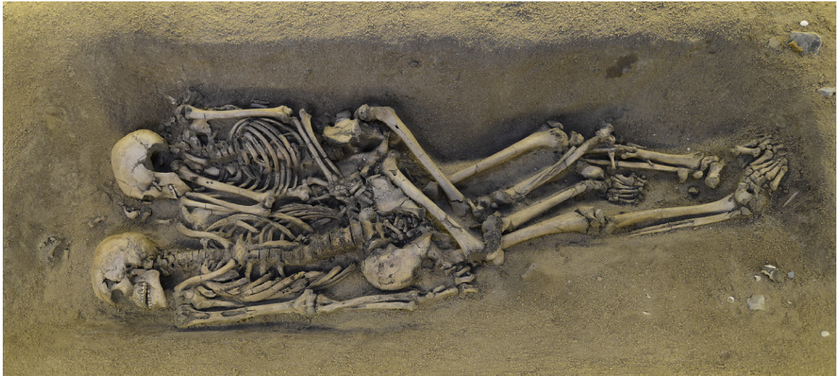
Dubbelgraven från Skateholm, nu på Trelleborgs Museum.

Hela Trelleborg är som en spännande historiebok där all vår historia finns med, alltifrån istiden och fram till idag. Som en följd av att Söderslätt under lång tid varit ett attraktivt jordbruksområde, och då här under senare tid bedrivits en nära nog total uppodling med moderna, djupgående plogar, har stora delar av beståndet av fornlämningar mer eller mindre förstörts. Mycket finns dock ännu kvar!