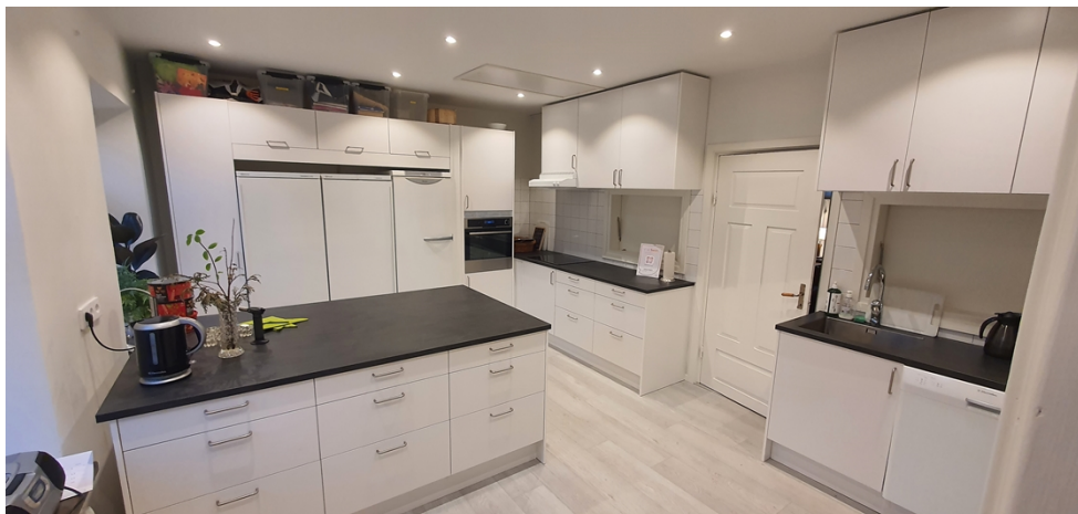
Bilden är på det färdiga köket i Södra Åbys byahus.

Stora Beddinge lekplats har börjats bygga under hösten tillsammans med byalaget. I år görs ett försök att låta föreningen stå för byggnationen medan projektet finansierar materiellt. Detta gör att Stora Beddinge har kunnat få en större lekplats med fler redskap. Byalaget har gjort ett mycket bra arbete och förhoppningen är att flera föreningar kan tänka sig samma upplägg i framtiden.