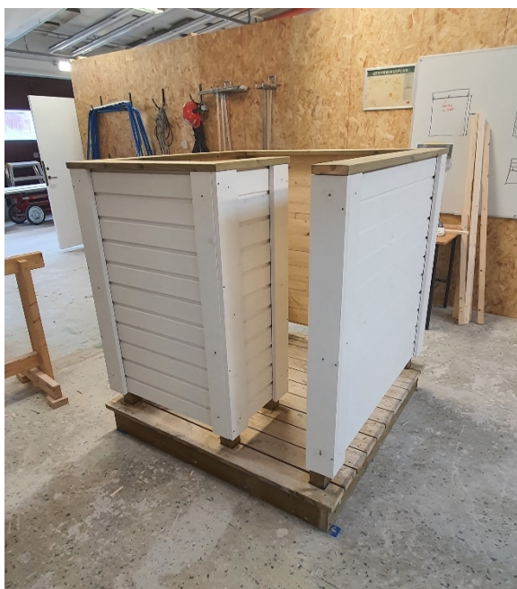
Bilden är på första versionen av badhytten, som sedan modifierades med en bredare ingång.

I medborgarbudgeten samverkar flera olika förvaltningar med skolor och föreningar för att öka kunskap bland barn och unga om demokratiska processer och delaktighet i lokalsamhället. I förslaget ”enklare omklädningsrum vid badplatserna” arbetar nu gymnasieelever på Söderslätts gymnasiums byggprogram med att förverkliga medborgarnas förslag – att bygga fyra enkla omklädningsrum till stränder och badplatser – genom att planera och utföra byggprojektet i samarbete med ansvariga tjänstepersoner. Projektet har stått för materialkostnaderna medan lärarna har lagt in arbetet som en del av undervisningen. Förhoppningen är att detta samarbete kan fortsätta årligen.