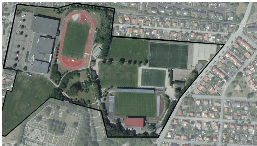
Bild 1, Projektområde

Projektområdet åskådliggörs i bild 1. Marken som berörs ägs idag av kommunen.