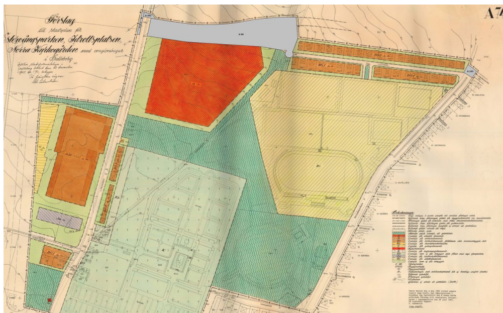
Bild 2, Utklipp från Stadsplan A74 för området.