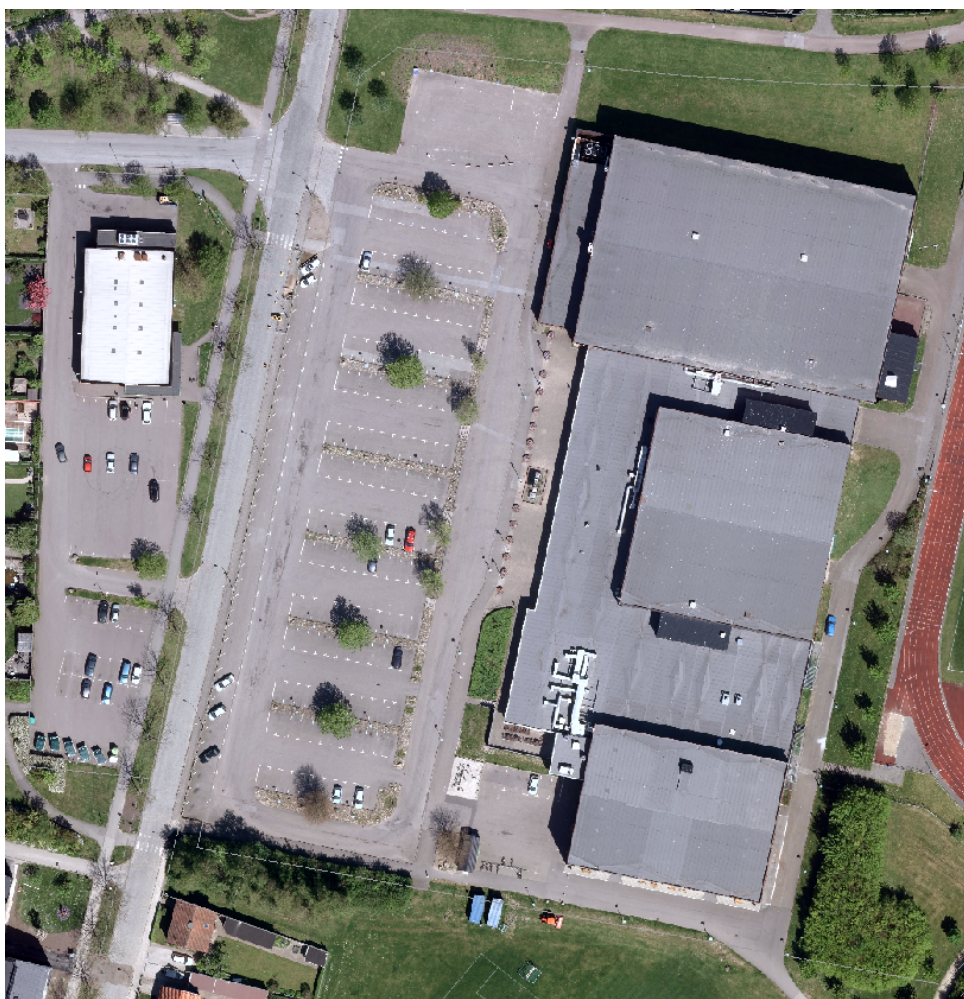
Figur 2: Söderslättsshallen med anslutande parkering.

I dagsläget finns det 207 parkeringsplatser och plats för tre-fyra bussar på den cirka 9000 m 2 stora parkeringsytan (se figur 2). 2012 togs det fram ett förslag som maximerar antalet platser på befintlig parkeringsyta vilket skulle generera 240 bilplatser och sex bussplatser (se figur 3). En upprustning enligt förslaget innebär bland annat att belysning och laddplatserna (parkering för elbilar) måste flyttas, vilket skulle öka kostnaderna. Enligt siffror från 2012 skulle enbart kostnaden för ny belysning (exkluderat grävning och återställning av mark) uppgå till 179 000kr ex moms.