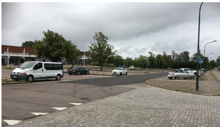
Figur 1: Söderslättshallensparkering

Utöver tekniska serviceförvaltningen har även Kultur- och fritidsförvaltningen tagit del av motionen. Kultur- och fritidsförvaltningen delar motionärens uppfattning om att den befintliga parkeringen oftast inte räcker till för den verksamhet som bedrivs i och runt Söderslättshallen. Kultur- och fritidsförvaltningen delar även uppfattningen att det föreligger ett större renoveringsbehov vilket ska ha påtalats för serviceförvaltningen under ett antal år.