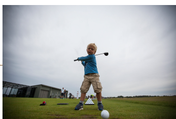
1 | KLUBBKVAL

PGA Pro skall vara involverad i klubbens/anläggningens verksamhet samt ha någon av medlemskategorierna, PGA assistent Professional, Golf Professional eller Golf manager Professional.