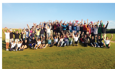
3 | SVERIGEFINAL TRELLEBORG