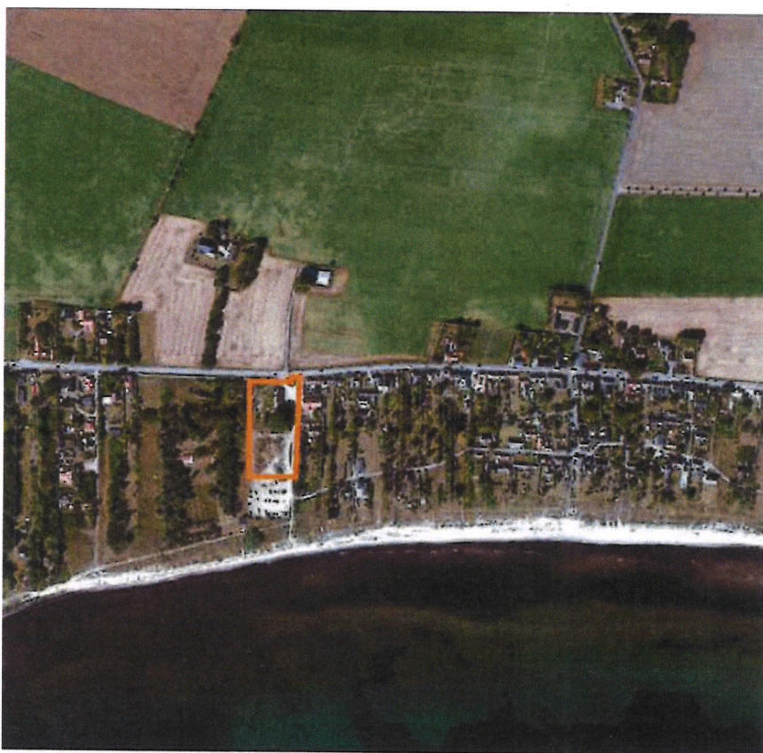
Karta som visar planområdets avgränsningar.