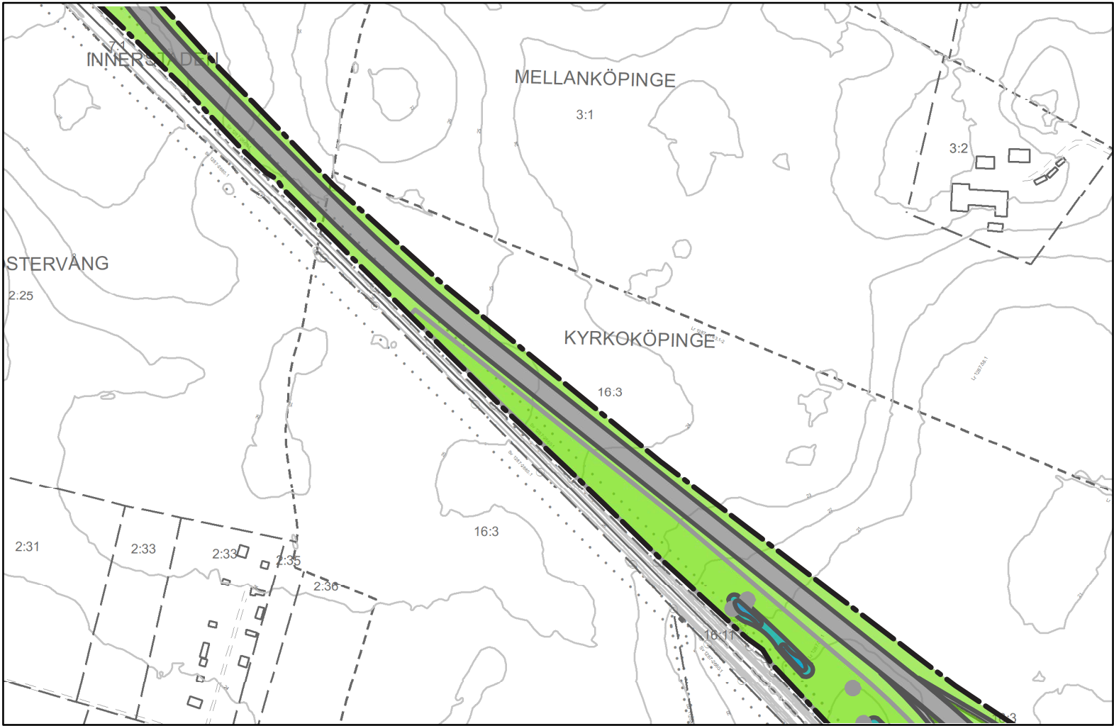
ILLUSTRATION BLAD C