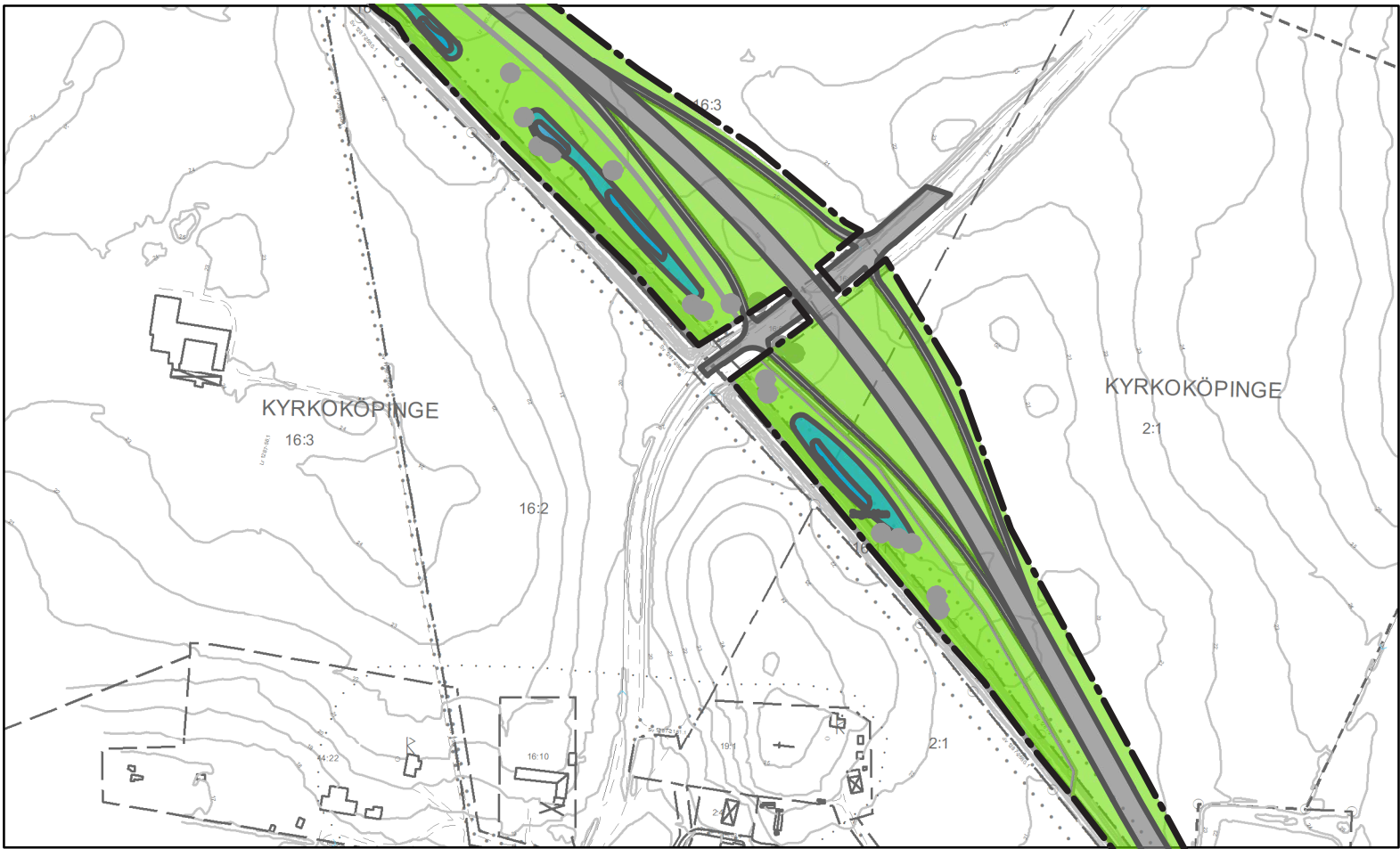
ILLUSTRATION BLAD D