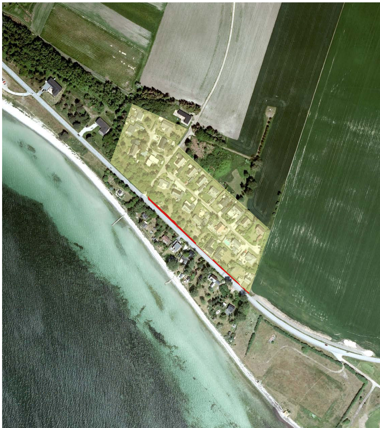
Ortofoto med planområdets avgränsning i gult. Markerat område i rött omfattar den del av detaljplanen som upphävs.