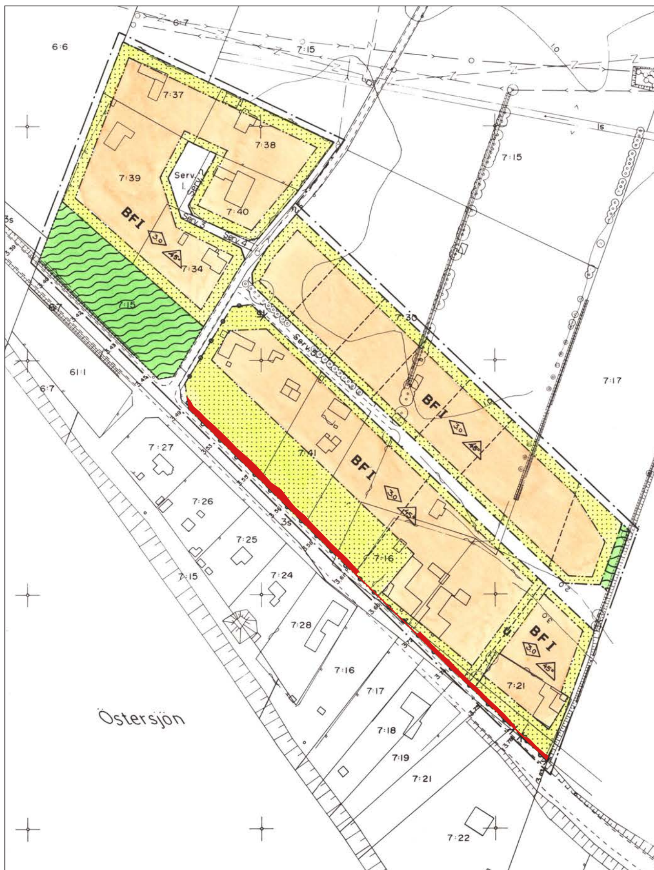
Ändring i B25; del av detaljplan som upphävs och som av Trafikverket uppläts för vägrätt är markerat i rött.