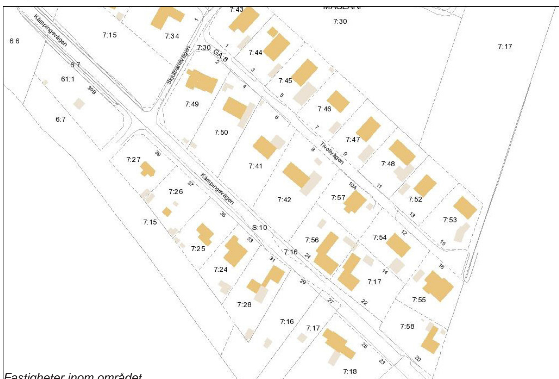
Fastigheter inom området

Eventuell påverkan på berörda fastigheter behandlas i Trafikverkets vägplan. Ändringen av detaljplanen förutsätter inga fastighetsrättsliga åtgärder.