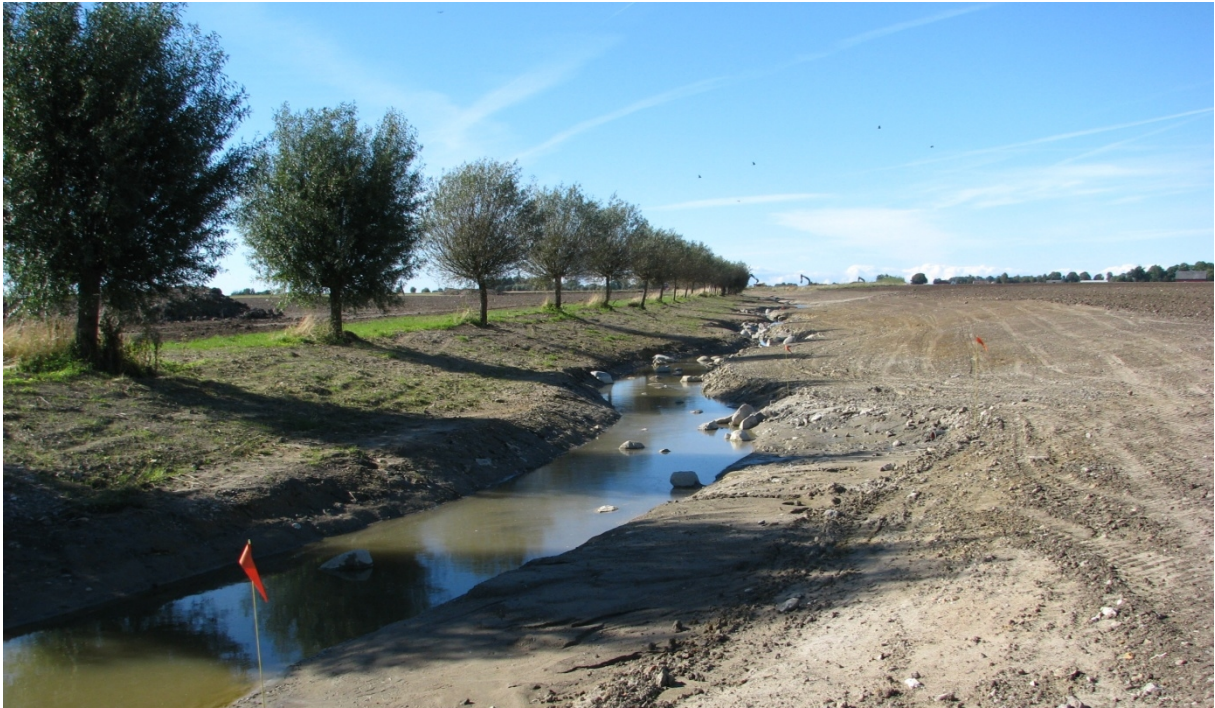
Foto 2. Avfasade dikeskanter med god beskuggning (Foto: Maria Adolfsson).

Träd intill vattendrag ger skugga och lägre vattentemperatur samt förhindrar igenväxning av vattnen. Behovet av att rensa blir därmed mindre och vattnets flöde hindras inte. Dessutom kan träd och buskar gynnar den landlevande faunan och skapa spridningskorridorer för många djur och växter.