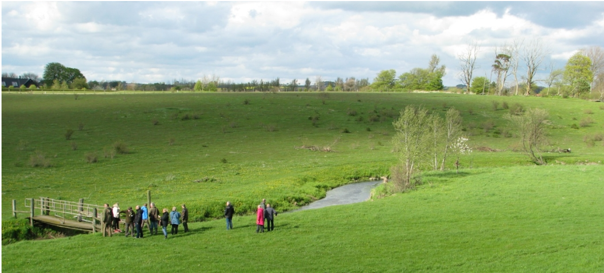
Foto 3. Vandring längs vatten är en fin friluftsupplevelse.