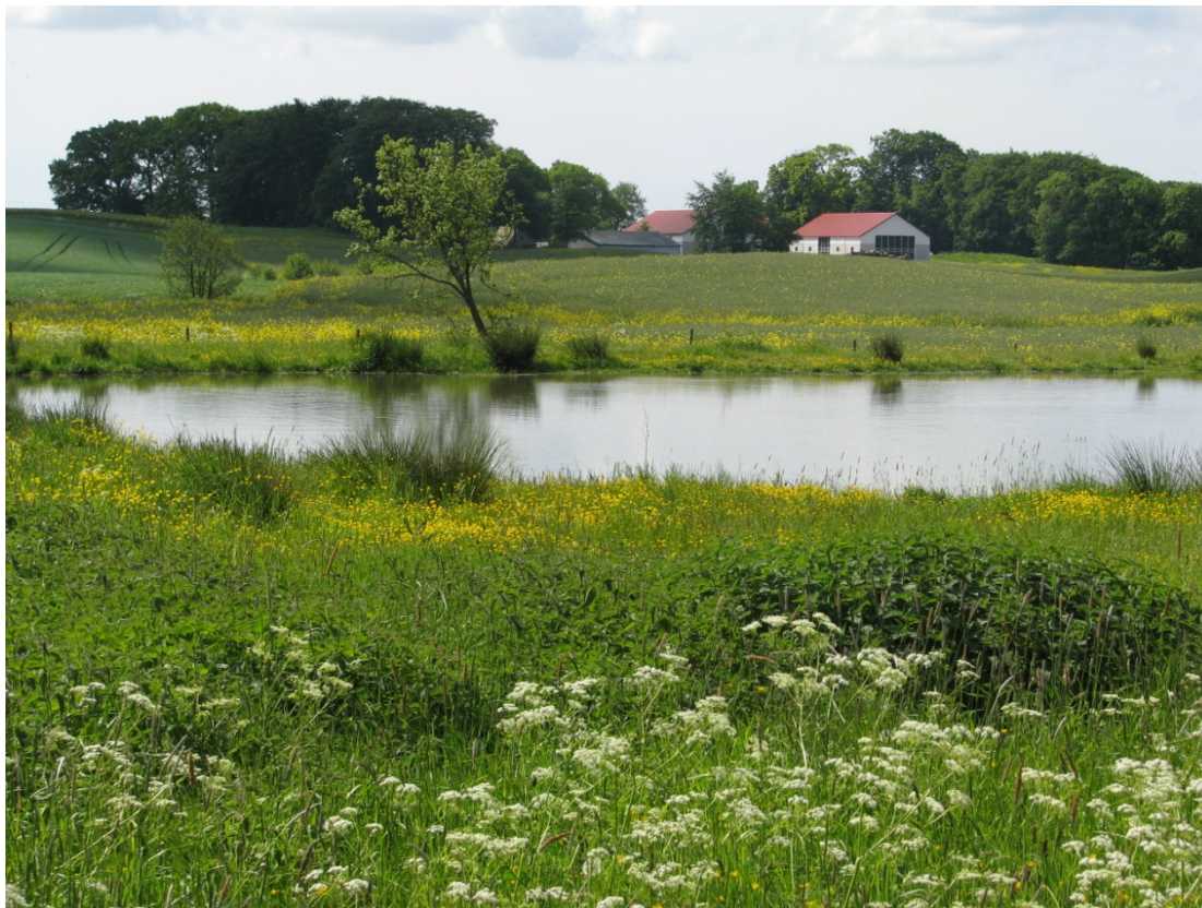
Foto 1. Anlagd våtmark i anslutning till Skivarpsån.

Målsättningen med Sydväståprojektet är att anlägga 25 ha våtmarker och dammar 2017-2021.