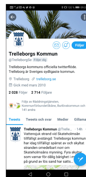
LinkedIn och Twitter