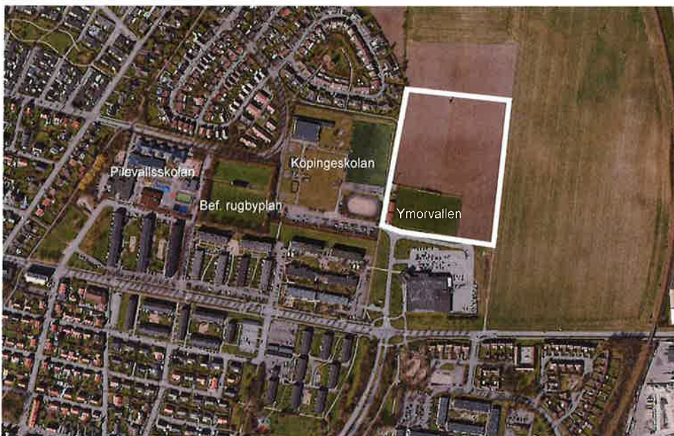
Område som begäran om planbesked avser markerat i vitt med omkringliggande bebyggelse

Området ligger i de östra delarna av Trelleborgs stad. Området ligger i direkt anslutning till skol- och idrottsområdet Pilevallsskolan och Köpingskolan. Området omfattar ca 5 hektar och utgörs till största delen av jordbruksmark. I den södra delen av området ligger Ymorvallen, med befintlig fotbollsplan och tillhörande omklädningsrum och klubbhus.