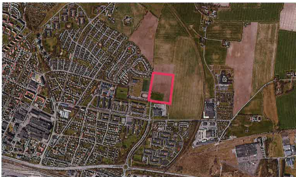
Område som begäran om planbesked avser