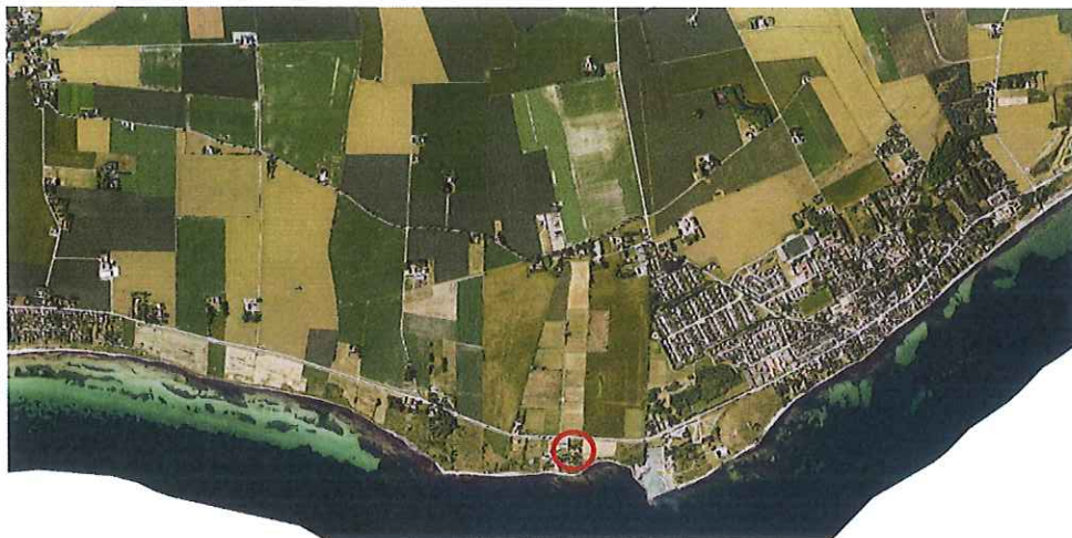
Ortofoto, markerat område visar fastighetens lokalisering.

Området som planbeskedet avser är lokaliserat i den sydöstra delen av Trelleborgs kommun, mellan Böste och Smygehamn, direkt söder om väg 9, Smyge fyrväg. Fastigheten är cirka 7 500 kvadratmeter stor och består av två huvudbyggnader, flertal komplementbyggnader, grönytor och parkeringsytor.