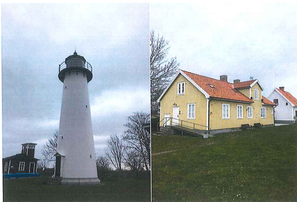
Foton på fyren och vandrarhemmet (gul byggnad).

Inom området finns ett flertal byggnader som är kulturhistorisk värdefulla. Även miljön kring byggnaderna är värdefull. Utmärkande på platsen är framförallt fyren. Vid en detaljplanläggning ska en närmre inventering ske. Planbestämmelser som reglerar material, färg och utformning kan bli aktuellt. Även förbud mot rivning.