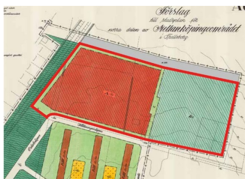
Inom markerat område upphävs tomtindelningen