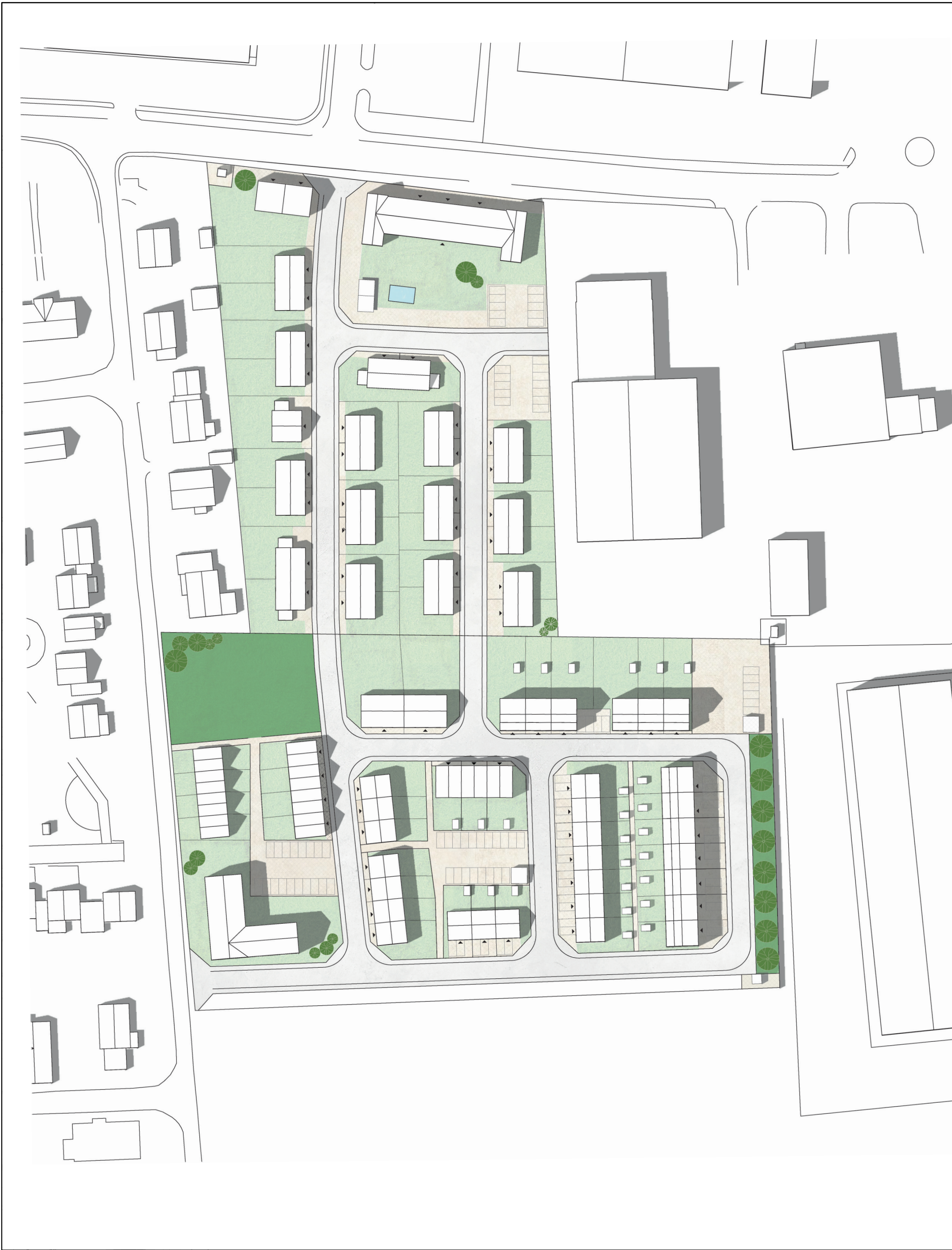
ILLUSTRATION 0 12,5 25 50 Meter