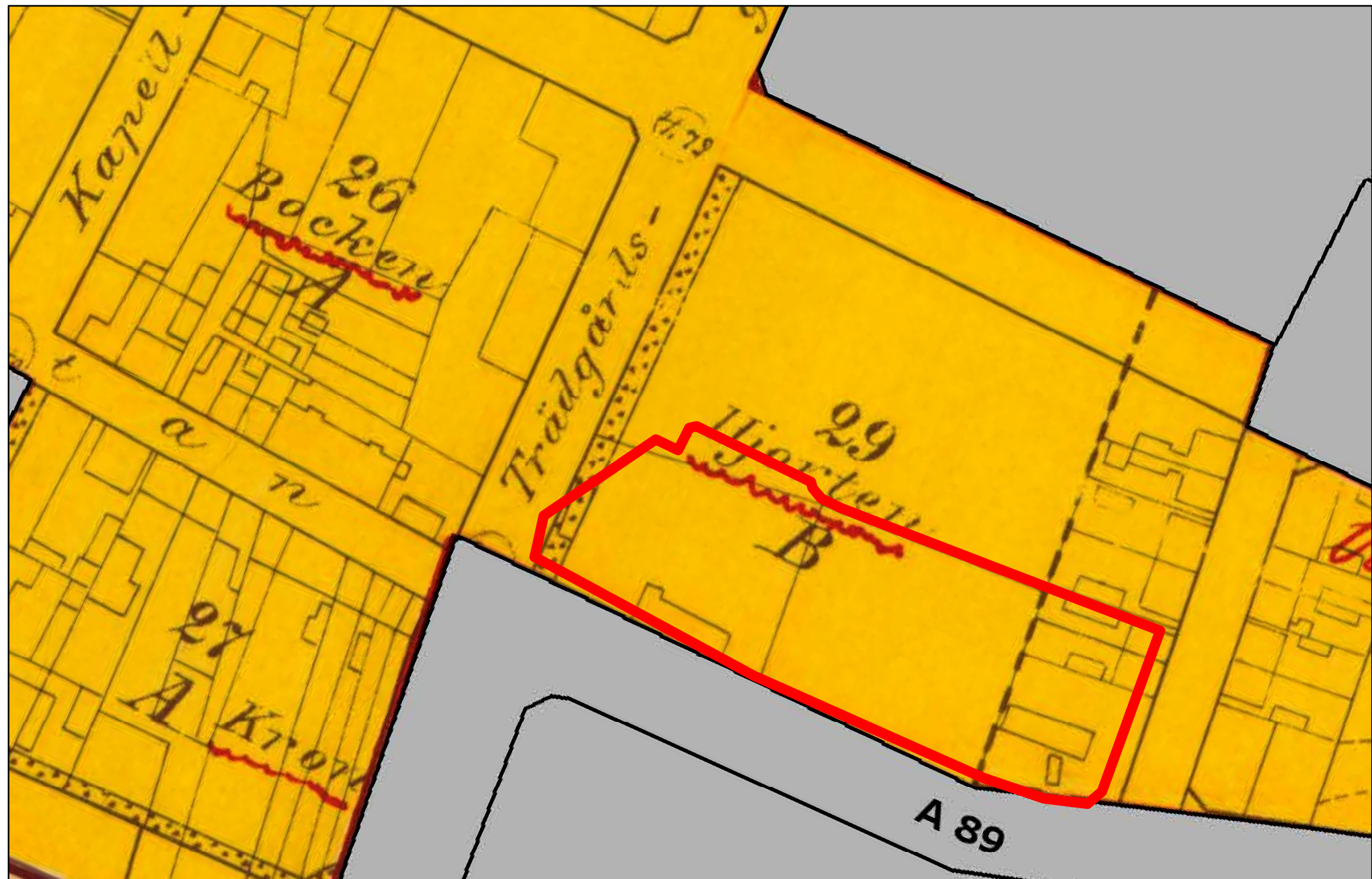
Utdrag från STADSPLAN A0 för Trelleborgs stad 0 10 20 40 Meter Skala 1:1000 (A2) 1:2000 (A4)