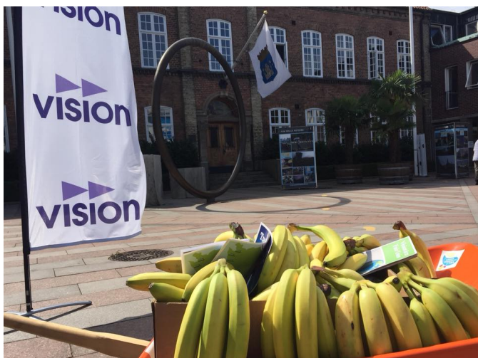
Visions mobila center på besök på Rådhusorget.

30 augusti: Styrgruppsmöte nr 3 hölls på Visit Trelleborg