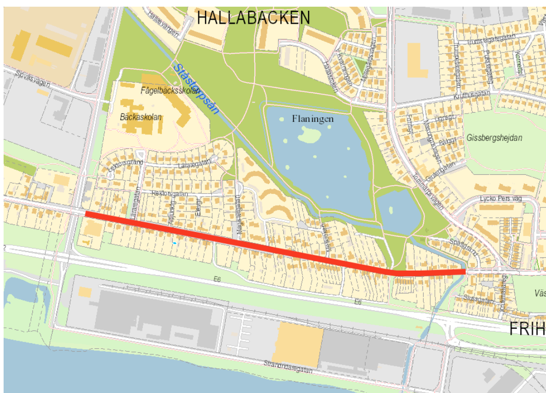
Figur 1: Den röda markeringen i kartan visar den 900 meter långa sträckan där det inte finns någon specifikt utmärkt passage över Stävstensvägen.