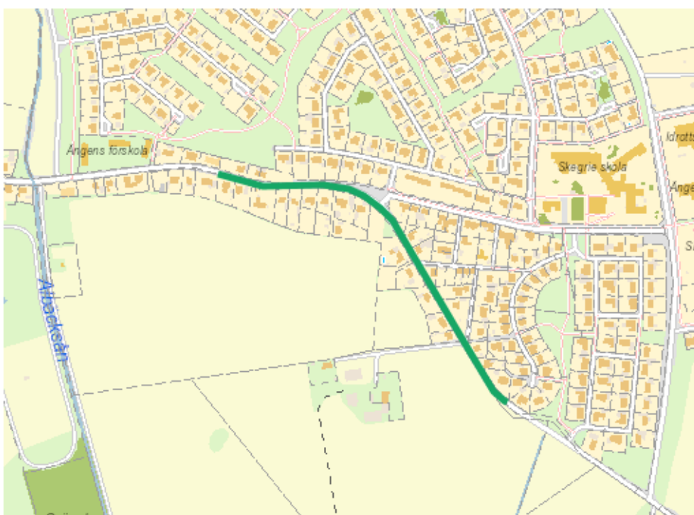
Figur 3: Ungefärlig sträcka som föreslås regleras om till 30 km/tim.