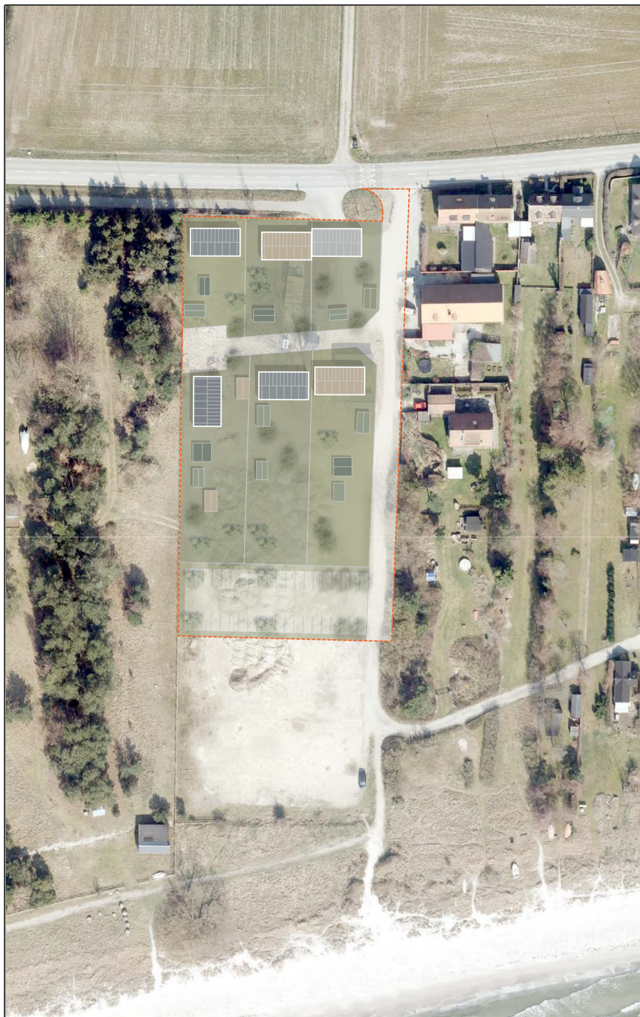
ILLUSTRATION 0 12,5 25 50 Meter Skala 1:1000 (A2) 1:2000 (A4)