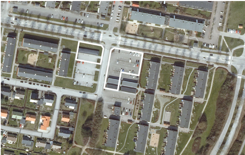
Kartan visar planområdets avgränsningar.

Planhandlingarna består av planbeskrivning och plankarta med illustration.