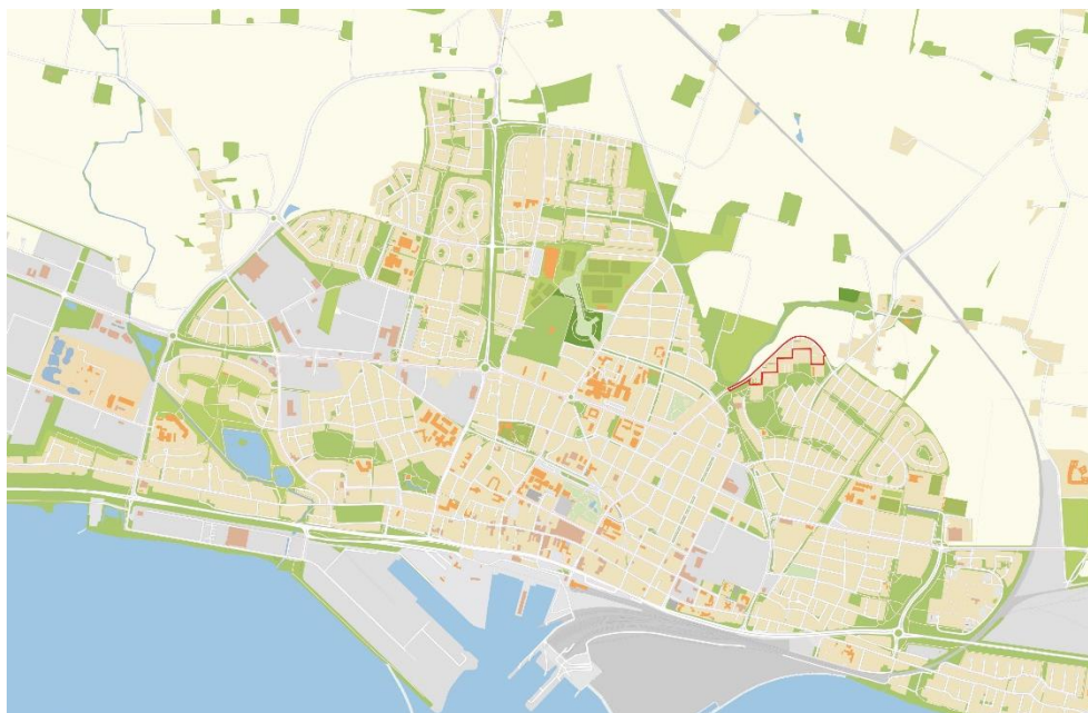
Kartan visar planområdets avgränsning

Planhandlingarna består av planbeskrivning, plankarta, illustration och samrådsredogörelse.