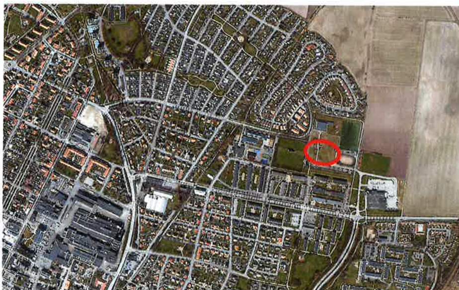
Område som begäran om planbesked avser

uppdra åt Samhällsbyggnadsförvaltningen att göra en ändring av detaljplan A 185 för att tillåta byggnadshöjden 12 meter. Ändring av detaljplan ska tas fram enligt standardförförande i plan- och bygglagen samt i enlighet med förvaltningens tjänsteskrivelse.