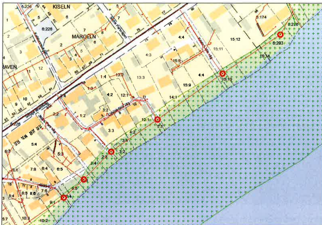
Kartbild med brunnars placering och utbredning av strandskydd (brunnar markerade med röda ringar)