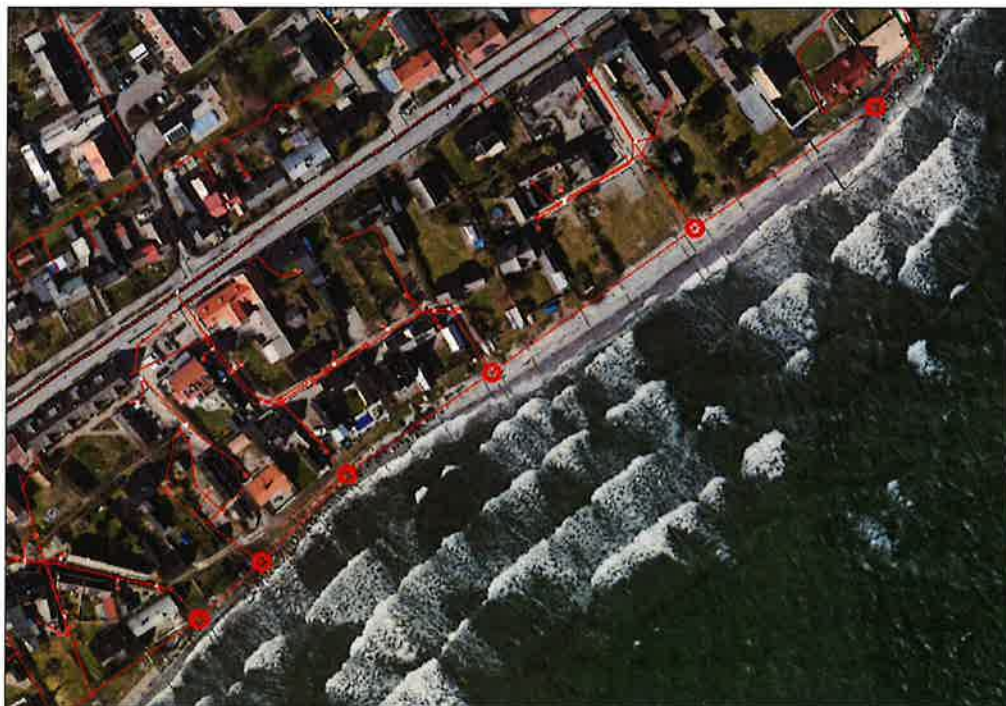
Ortofoto med brunnars placering (brunnar markerade med röda ringar)