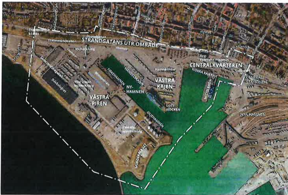
Karta som visar planprogramsområdets avgränsning.

- att ställa sig bakom förslaget till planprogram för Sjöstaden i Trelleborg och översända det till kommunstyrelsen för ett godkännande i kommunfullmäktige