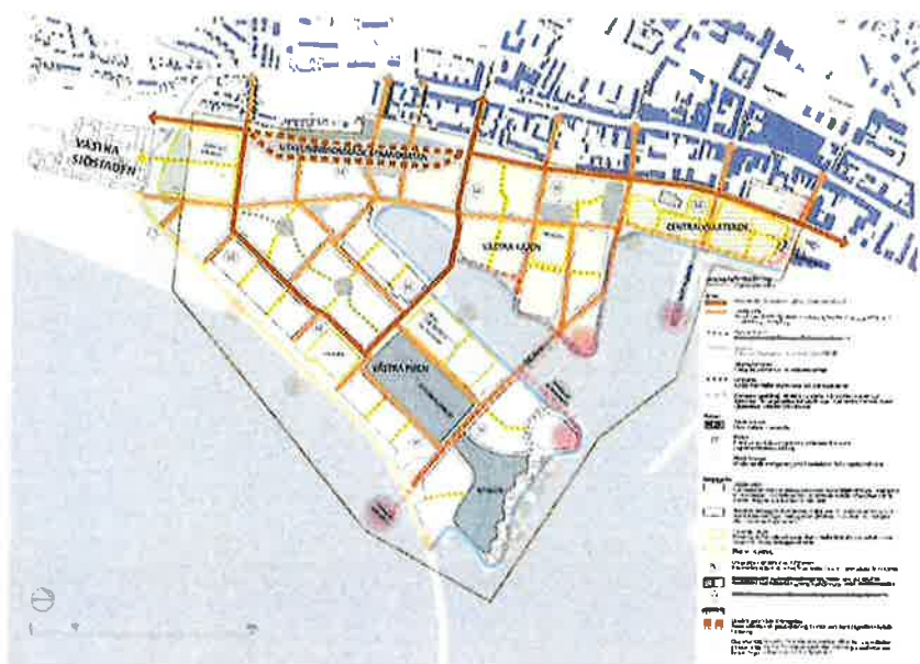
Karta som visar planförslaget.