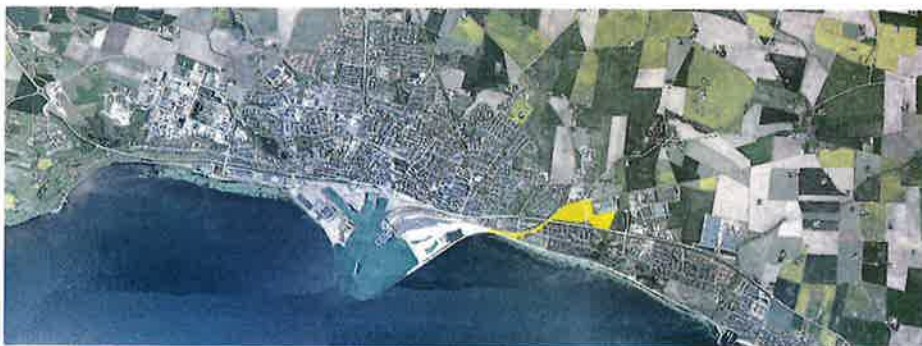
Planområdet för evakuerings- och angreppsväg/framtida östlig hamninfart