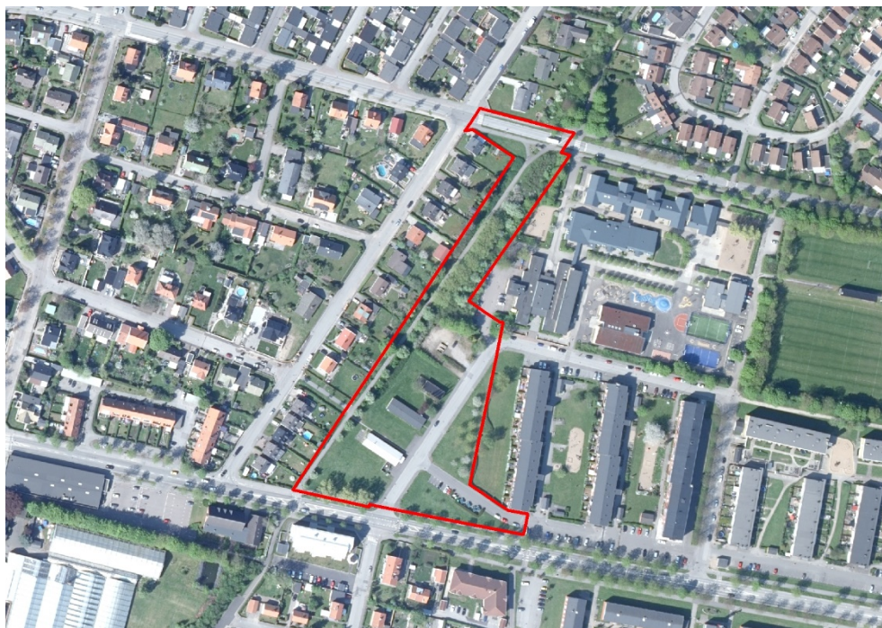
Planområdet med omgivning

Planhandlingarna består av planbeskrivning, plankarta och illustration.