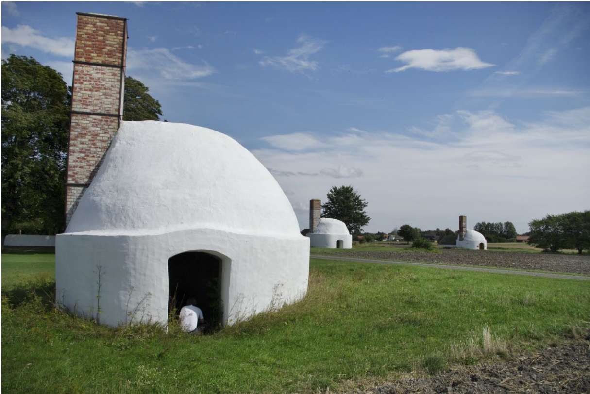
Små hattstugor? Nej, vitmenade kalkugnar!

Köpmansgården är namnet på gården strax öster om hamnen. Det stora pampiga magasinet är byggt i början av 1800-talet och minner om tider när smuggling var ett närtintill aktat levebröd för många, såväl grosshandlare som bönder och deras medhjälpare. Med magasin ända nere vid vattnet hade man stora möjligheter att undgå nitiska tulltjänstemän!