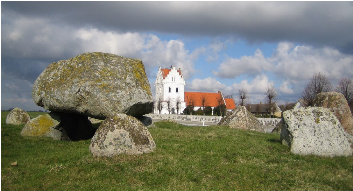
Skegriedösen med Skegrie kyrka i bakgrunden.