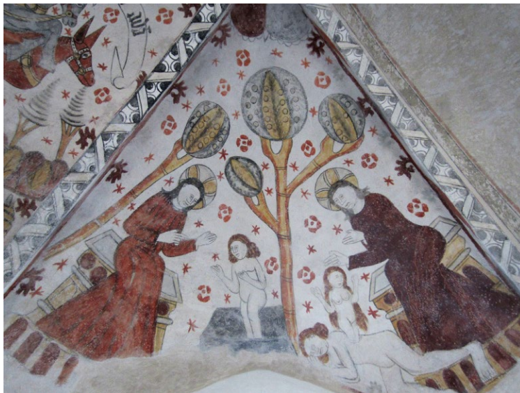
Målningar från valven i Äspö kyrka.

Även kyrkogårdarna innehåller många spännande och intressanta stenar. I Västra Torp finns till exempel en sten som sägs förebåda oväder – den lär gråta innan det kommer regn! Lilla Isie kyrkogård och Lilla Beddinge kyrkogård är två ödekyrkogårdar, båda högst sevärda. Inne i Trelleborg har såväl Västra som Norra Kyrkogården mycket att berätta om gamla tiders stadsbor. Flera kända trelleborgssläkter ligger begravda här. Norra kapellet är i sig också en sevärdhet.