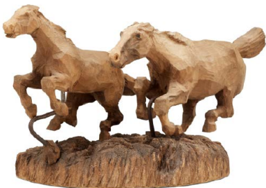
Islandshästar i naturlig storlek.