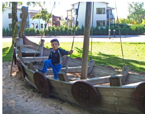
Inspirationsbilder från lekplatser i Sverige och England (och en bild från Wasamuseet)