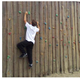
Klättervägg för de större barnen Ormen skulle också kunna användas till klättring.