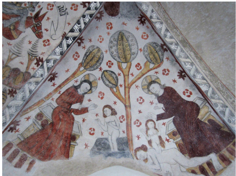
Målningar från valven i Äspö kyrka.

Även kyrkogårdarna innehåller många spännande och intressanta stenar. I Västra Torp finns till exempel en sten som sägs förebåda oväder – den lär gråta innan det kommer regn! Lilla Isie kyrkogård och Lilla Beddinge kyrkogård är två ödekyrkogårdar, båda högst sevärda. Inne i Trelleborg har såväl Västra som Norra Kyrkogården mycket att berätta om gamla tiders stadsbor. Flera kända trelleborgssläkter ligger begravda här. Norra kapellet är i sig också en sevärdhet.