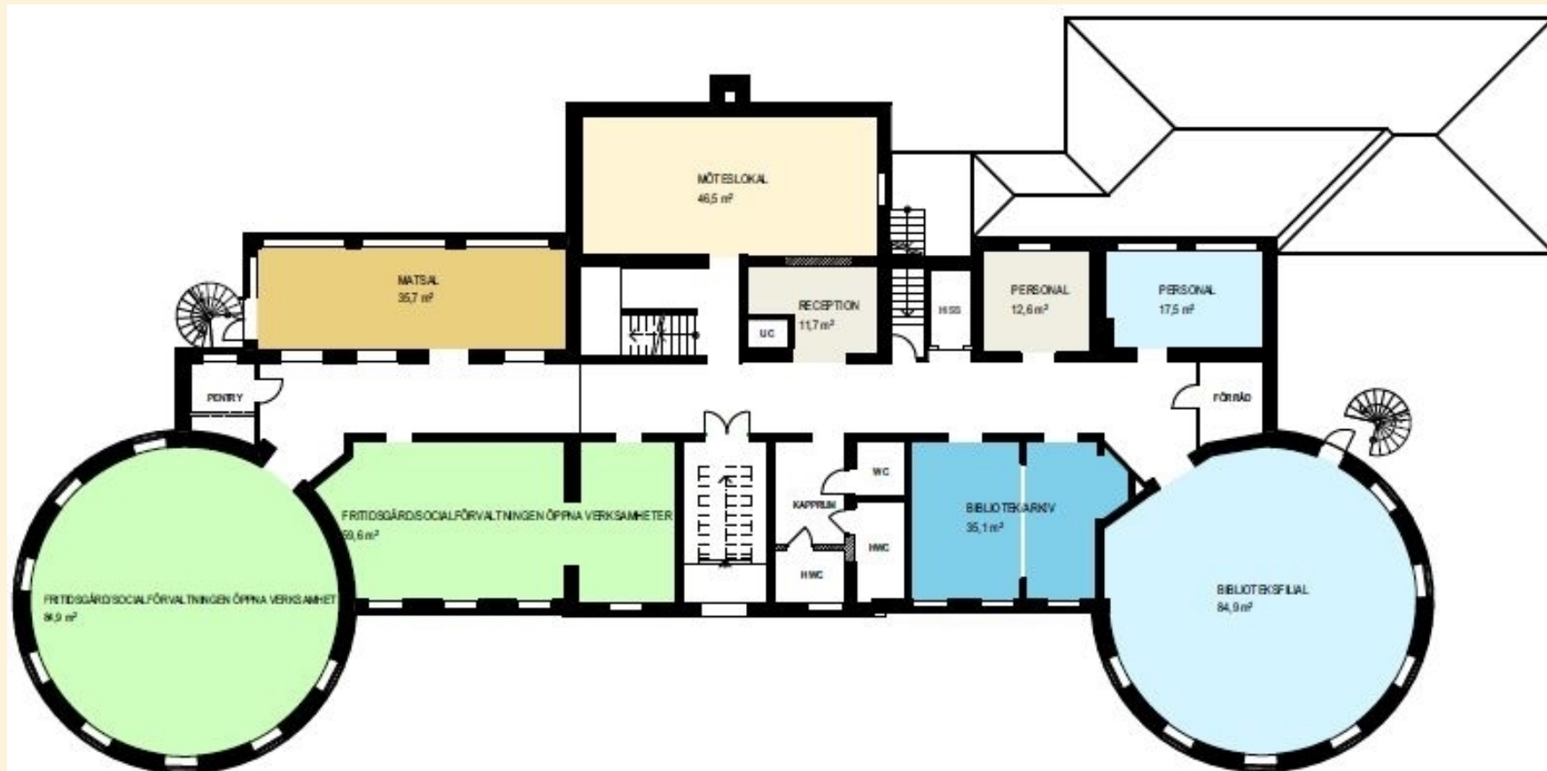
ENTRÉPLAN: Publik verksamhet