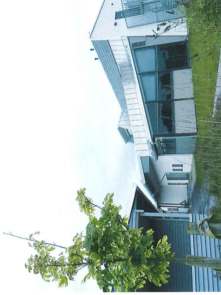
Slättens förskola, Skegrie

Fakta och förslag till strategi 2016 - 2022