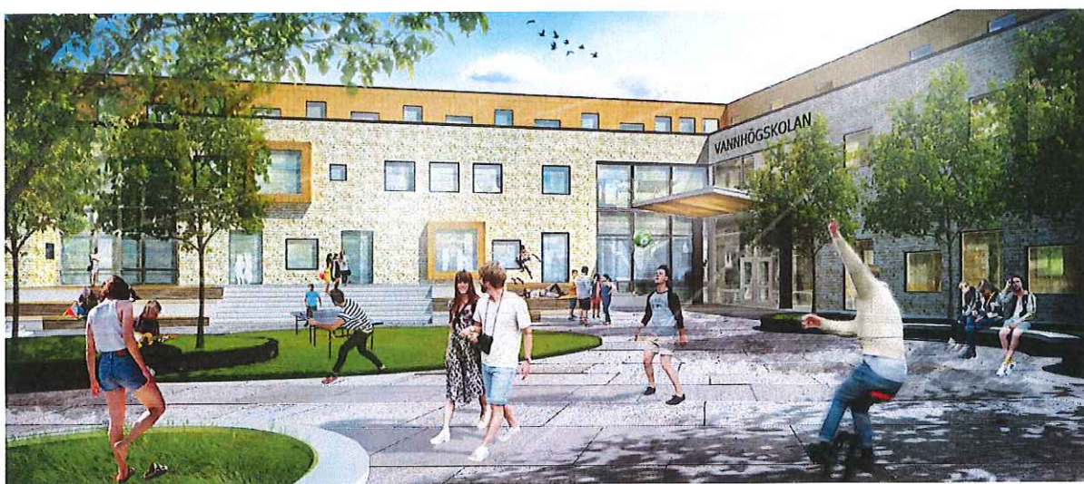
Illustration nya Vannhögsskolan (bild Chroma arkitekter AB)