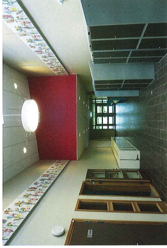
Pilevällskolan nybyggnad hus D

Fakta och förslag till strategi 2016 - 2022