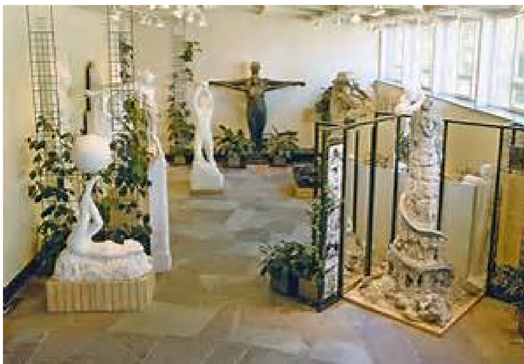
Interiören på Axel Ebbes Konsthall