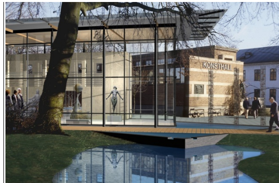
Bilder från utredningen "Behöver konsten ett nytt hus" av Ulla Ahnfelt 2002. Tankar på en tillbyggd AEK: