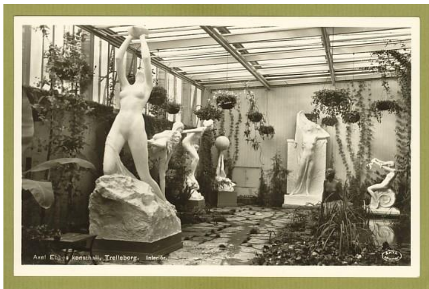
Som AEK såg ut i början.

Med denna enkla historiebeskrivning kan det konstateras att AEK alltid varit en byggnad som på olika sätt berört kommuninvånarna och vid flera tillfällen varit föremål för utvecklingsinsatser.