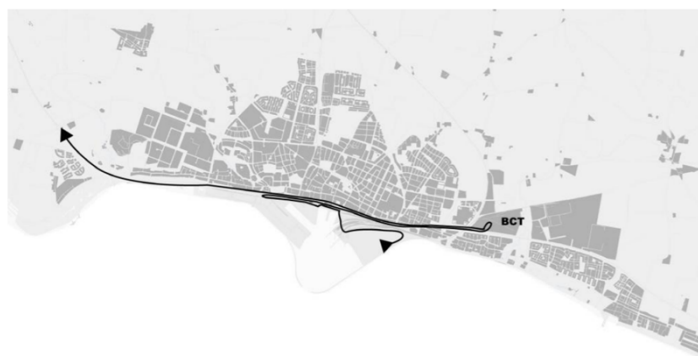
Körväg vid västlig tillfart och BCT i öster

Att kommunen satsar på strategin "måla in sig i ett hörn" är lika tydligt som någonsin. Det är ett högt, dyrt och oansvarigt spel med kommuninvånarnas skattemedel, som ger en stor oro och splittring bland många trelleborgare. Så här borde inte ett gigantiskt samhällsbyggnadsprojekt fungera i en kommun.