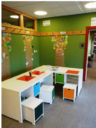
Kreativt rum i naturum.