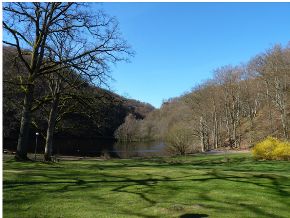
Utsikt från naturum.

Få inspiration och vägledning ut i nationalparken genom att titta in i naturum Söderåsen - besökscentrat vid huvudentrén i Skäralid. Här får du veta mer om områdets speciella natur och får tips på vandringar och sevärdheter.